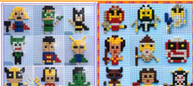
(創意積木示意圖，隨機給款)