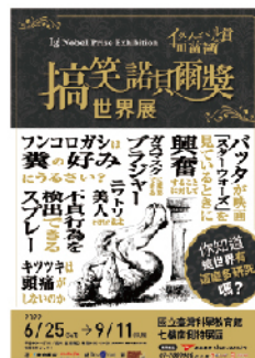
搞笑諾貝爾獎世界展