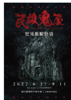
民雄鬼屋實境體驗特展