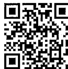
繳件 QR code